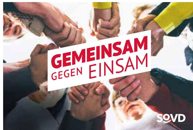
Gemeinschaft und Solidarität sind Stärken des SoVD. Diese vermittelt er auch in der Kampagne „Gemeinsam gegen einsam“.

Der SoVD bietet gelebte Gemeinschaft und Solidarität. Mit der Kampagne „Gemeinsam gegen einsam“ will der Verband das Thema in den Fokus rücken und Menschen die Hand reichen, ihnen Mut machen und helfen, wo immer Hilfe benötigt wird. Die Kampagne wird viele Aspekte von Einsamkeit aufgreifen und digital bespielen. Eine eigene Kampagnenseite ist unter www.sovd-gemeinsam.de eingerichtet. Dort gibt es Informationen zum Thema sowie über die Angebote des SoVD und die Forderungen des