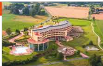
4+ Kurzentrum Weißensadt am See

Freizeit/Kur/Unterhaltung: Verbringen Sie entspannte Stunden in der Bade- und Wellnesslandschaft des Kurzentrums, welche über ein ganzjährig beheiztes Außenbecken, Schwimmbad, Whirlpool, Sonnengalerie, Finnische Sauna und Biosauna, Dampfbad und Infrarotkabine verfügt. Die ca. 3.000 m 2 große Therapieabteilung mit Fachärzten hält eine große Vielfalt an Therapie-, Fitness- und Gesundheitsangeboten sowie Kosmetik- und Verwöhnbehandlungen bereit. Spezielle Radonanwendungen versprechen zudem einen besonderen Kur-Erfolg.