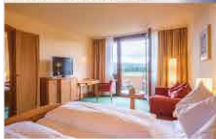
Zimmerbeispiel, 4+ Kurzentrum Weißensadt am See