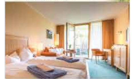
Zimmerbeispiel, 4+ Kurzentrum Waren (Müritz)