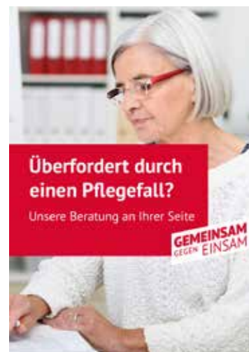
Ein Motiv auf Social Media.

„Gemeinsam gegen einsam“ läuft bis zur regulären Bundesverbandstagung des SoVD im November 2023 und wird dort auch das Motto sein. str