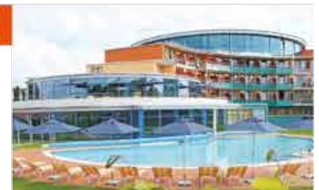
4+ Kurzentrum Waren (Müritz)

Freizeit/Kur/Unterhaltung: Die großzügige Bade- und Saunalandschaft verfügt über ein ganzjährig beheiztes Außenschwimmbekken/Thermalsoleaußenbecken (230 m 2 ), Schwimmbad (180 m 2 ), Whirlpool, Finnische Sauna, Bio-Sauna, Aroma-, Soledampfbad und Infrarotkabine. Auf ca. 2.000 m 2 bietet das Kurzentrum eine einzigartige Vielfalt an Verwöhn- und Therapieanwendungen sowie Fitness- und Gerätetraining. Für einen ganz besonderen Frischekick und neue Energie sorgt die Ganzkörperkältekammer mit minus 110°C.