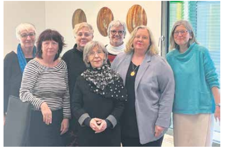
Beim Seminar „Soziale Medien“ des Frauenpolitischen Ausschusses.

Doch selbst bei vergleichbaren Tätigkeiten und Erwerbsbiografien waren es noch 7 Prozent Lohnabstand – ohne